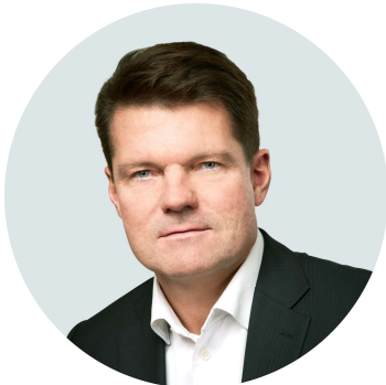
Голова Наглядової Ради Нільс Мелнгайліс

Звернення до акціонерів / учасників та інших стейкхолдерів від голови ради особи