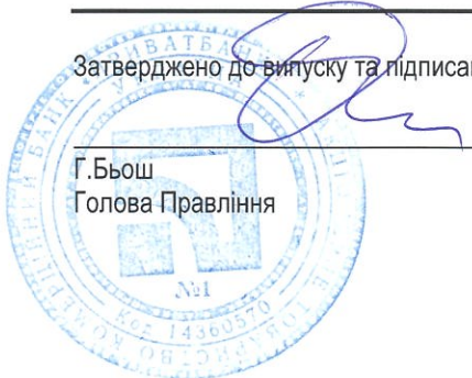
Г.Бьош Голова Правління

Затверджено до вилучення та підписано 15 березня 2024 року.