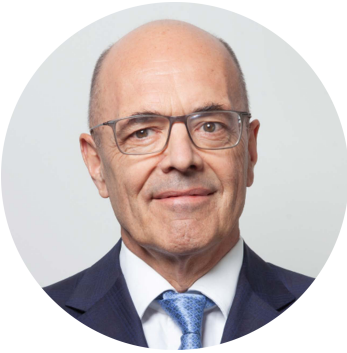
Голова Правління ПриватБанку Герхард Бьош