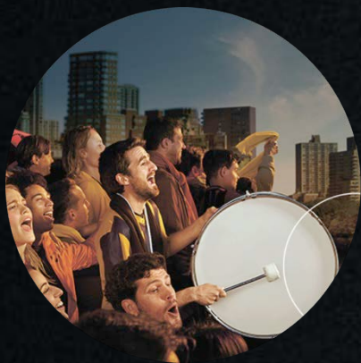
Фінали Ліги чемпіонів