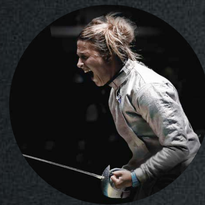
Відкриття Олімпійських ігор

Тільки VIP-клієнти ПриватБанку отримують безцінний досвід та унікальні пропозиції від платіжних систем Mastercard і Visa на події, доступ до яких можливий лише для обраних.